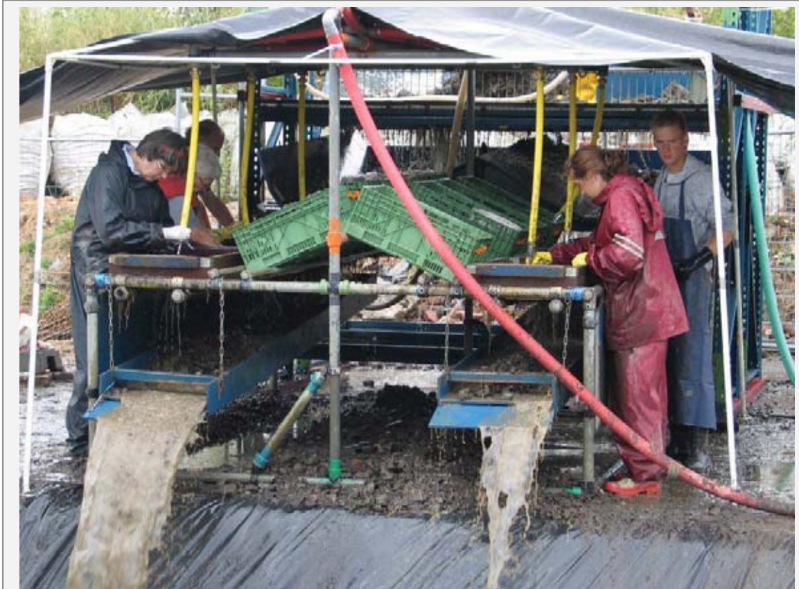
Werk aan de zeefinstallatie in Zevenaar, zeven grachtvulling middeleeuwse burcht.

Een bijzonder leuke samenwerking met andere lokale/regionale erfgoedorganisaties en instellingen vindt plaats in Arnhem. 4-5 keer per jaar wordt er een Historisch Café georganiseerd, waar veel publiek, per keer ongeveer 100-150 man/vrouw, op af komt. Het programma wordt georganiseerd door leden van de AWN en andere Historische Verenigingen. In deze setting zijn AWN leden zowel bezoeker als publieksvoorlichter.