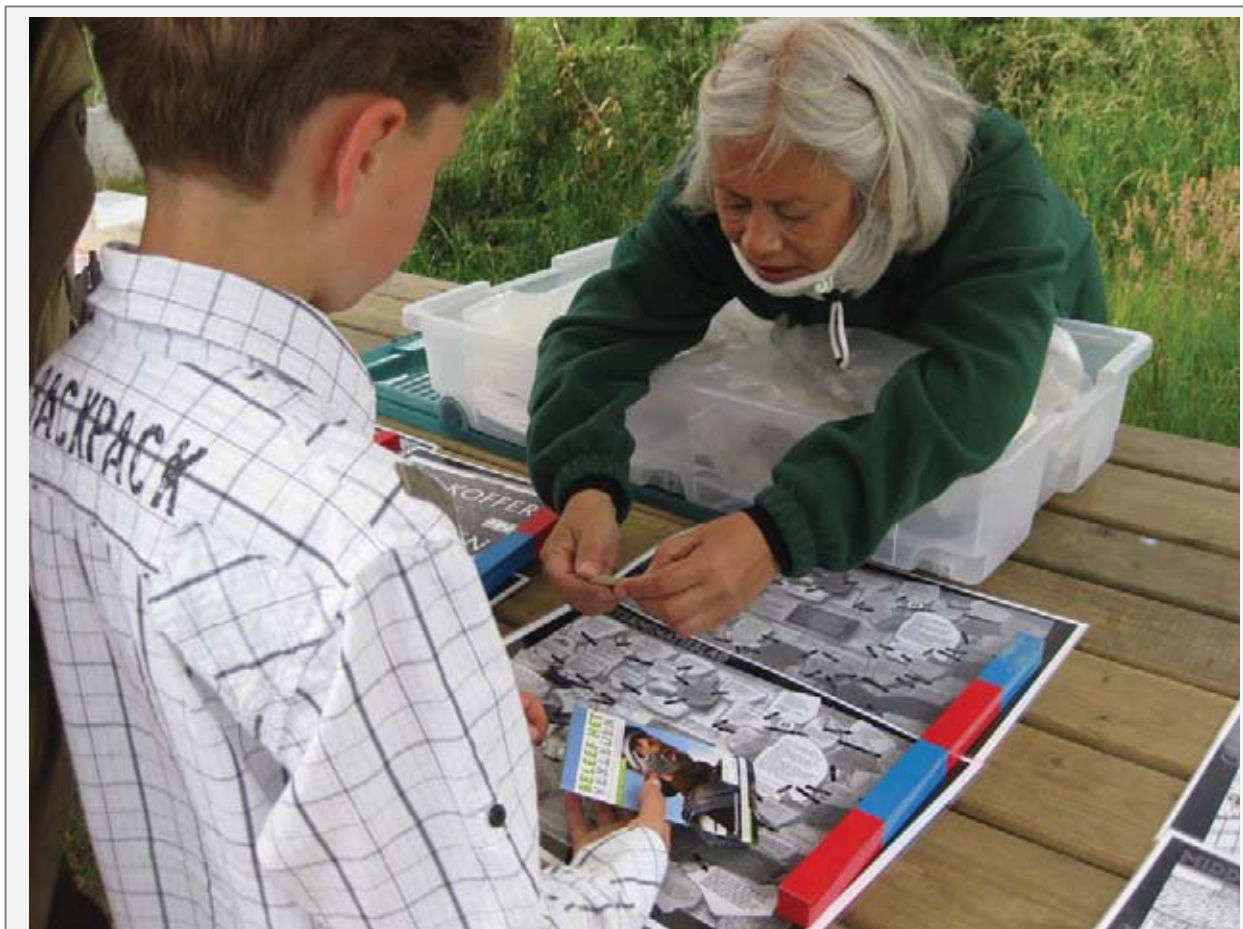
Tijdens het Weekend van de Archeologie werden leerlingen van het basisonderwijs rondgeleid en kregen uitleg over hoe boeiend en interessant archeologie is.

De werkgroep heeft een ondersteunende rol gespeeld tijdens het Weekend van de Archeologie samen met het Romeinenfestival op 18, 19 en 20 juni op het Kops Plateau in Nijmegen. 450 leerlingen vanuit het Nijmeegse basisonderwijs werden met enthousiasme onthaald en rondgeleid.