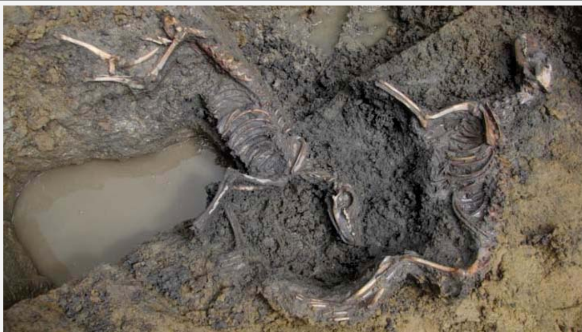
Hondengraf in het middeleeuwse vlak bij de opgraving Wickenburgh.

Mede in opdracht van de gemeente heeft de werkgroep op twee locaties in Houten archeologisch onderzoek verricht: het bouwhistorisch en archeologisch onderzoek op landgoed Wickenburgh en onderzoek naar sporen uit de IJzertijd en de Romeinse periode op het terrein van de voormalige Bernhardwegschool.