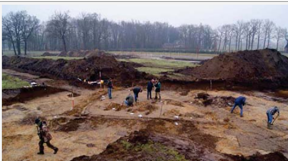
Opgraving Hengelo Broek Noord. Door toedoen van alerte AWN-ers zijn diverse vondsten gedaan die mede aanleiding waren voor opgravingen, o.a. verschillende brandgraven uit de IJzertijd.

Afdeling Twente heeft een structuur waar een aantal groepen redelijk zelfstandig in functioneren en ieder een eigen werkgebied hebben. Over het verslagjaar volgen hieronder de verschillende activiteiten van respectievelijk AWN/Archeologische Club Oldenzaal, AWN/Archeologische Werkgroep West Twente en AWN/Archeologische Werkgroep Haaksbergen.