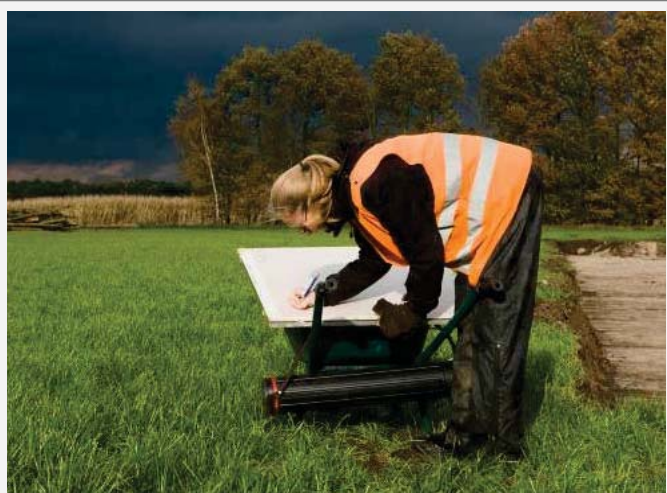
Weer of geen weer, het archeologisch onderzoek gaat gewoon door.

Het vergroten van het publieke bewustzijn van de waarde van ons cultureel erfgoed en als ogen en oren fungeren voor mogelijke bedreiging van ons cultureel erfgoed, is de missie van de afdeling. Om dit doel te bereiken wordt zo nodig invloed uitgeoefend bij overheden die betrokken zijn bij besluitvorming over archeologie en worden diverse activiteiten en voorzieningen aangeboden om zoveel mogelijk leden actief of passief bezig te laten zijn met archeologie. Een goede informatievoorziening tussen bestuur en publiek, overheden en leden is een voorwaarde.