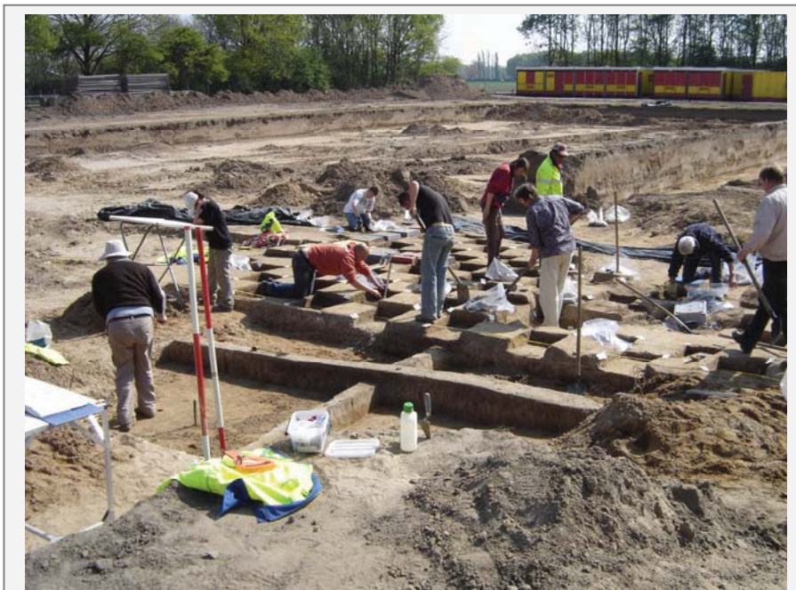
Assistentie van de leden van afd.16 bij de opgraving aan de Osterweg te Wijchen.