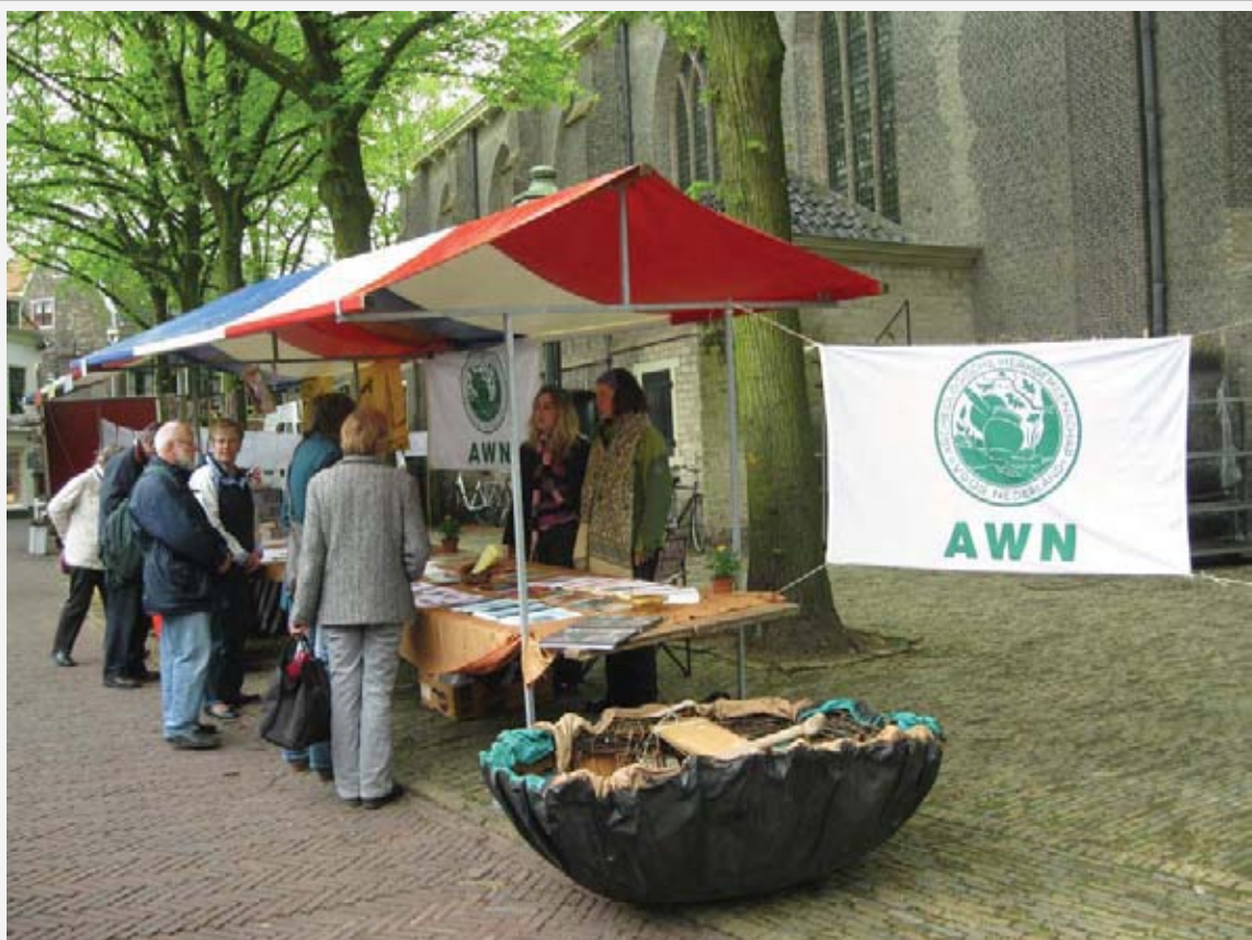
Er was veel belangstelling bij de stand van Afdeling 8. Helinium tijdens de Lentemarkt in Vlaardingen.

Om een aantal redenen blijkt de huidige juridische structuur van de AWN niet meer te voldoen. Tot nu toe is alleen de landelijke vereniging een rechtspersoon. Dat levert voor afdelingen problemen op. Zoals voor de registratie bij een bank, voor het sluiten van huurovereenkomsten, het ontvangen van subsidies en op te kunnen treden als belangenbehartiger. De discussie over een nieuwe juridische structuur is gestart op de afgevaardigden dag (20 november 2010). Een voorstel voor een nieuwe structuur en besluit is aan de orde op de Algemene ledenvergadering 2011.