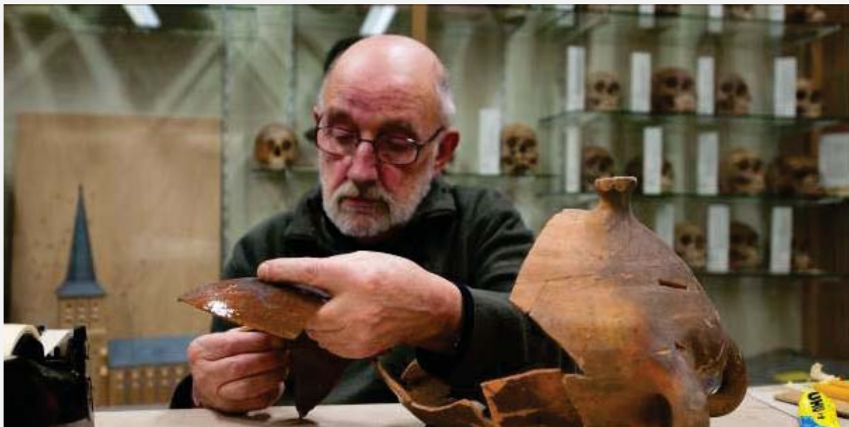
Passen, plakken en gipsen..... Foto uit het jaarverslag van afd. 23.

Als afdelingen belangstelling hebben om de ledenvergadering in hun werkgebied te laten plaatsvinden, dan ziet het bestuur uw suggesties graag tegemoet. U kunt uw belangstelling mededelen aan de algemeen secretaris of uw interesse tijdens de ledenvergadering mededelen. Voor de organisatie van de ledenvergadering zal vanuit het hoofdbestuur ondersteuning worden verleend.