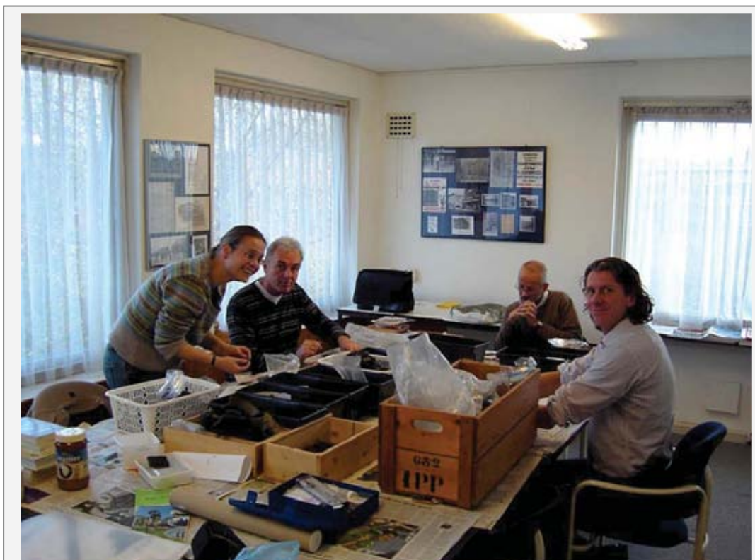
Werkgroep Dimis bezig met het uitwerken van vondsten in het agrarisch gebied van Diemen met het doel de ontginnings- en bewoningsgeschiedenis van het gebied in de vroege middeleeuwen in kaart te brengen.

De afdeling stelt zich ten doel om de bewoningsgeschiedenis in en om Amsterdam door eigen initiatief of door ondersteuning van gemeentelijke archeologische activiteiten in kaart te brengen en een bijdrage te leveren aan het bekend maken van de resultaten hiervan. De afdeling werkt hiertoe samen met de archeologische dienst van Amsterdam en met verschillende historische verenigingen in haar gebied (Diemen, Mijdrecht).